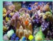
Eau de mer